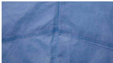
Abbildung 6: Spezielle Schweißtechnik für Nähte