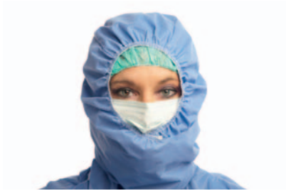
Abbildung 4: Wie gewohnt Haube und Mundschutz, dann Kapuze mit Mund- und Nasenverschluss