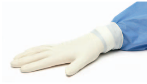
Abbildung 5: Handschuh über den Klettverschluss ziehen