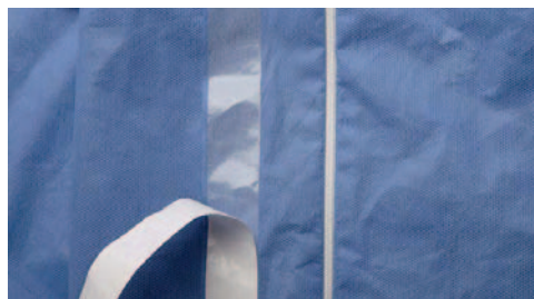
Abbildung 8: Doppelter Verschluss mit Klebeband